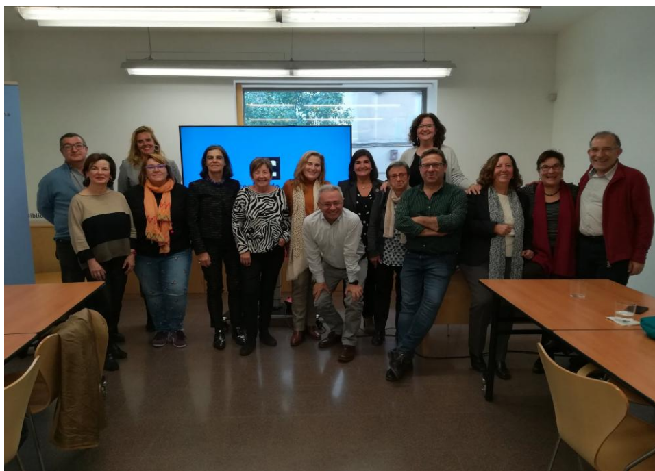
Trobada de mentors, novembre 2019

Al llarg de l'any, els mentors s'han posat a disposició de les biblioteques de la seva zona per assessorar i acompanyar en la millora dels projectes de caràcter social que realitzen o volen iniciar les biblioteques.